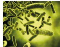
Salmonella: de bacterie die salmonellose veroorzaakt.

Ze zijn niet allemaal gevaarlijk: slechts een 100-tal van de 5000 bacteriesoorten zijn ziekteverwekkend. Sommige hebben we zelfs nodig: veel bacteriën in het spijsverteringskanaal zijn essentieel voor de vertering of voor de productie van vitamine K. Maar andere soorten leiden tot voedselvergiftiging of besmettelijke ziektes zoals cholera, syfilis, de pest, lepra, miltvuur en tuberculose.