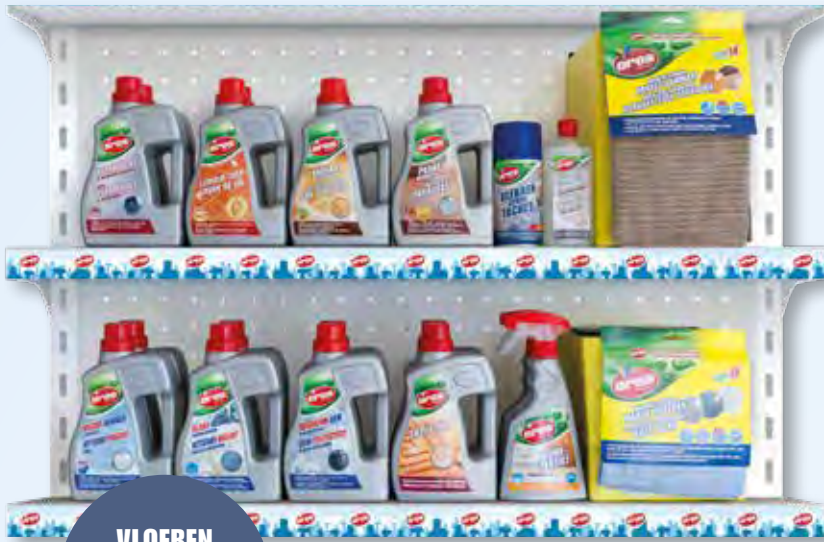
VLOEREN SOLS FLOORS

ANDERE VOORBEELDEN D'AUTRES EXEMPLES OTHER EXAMPLES